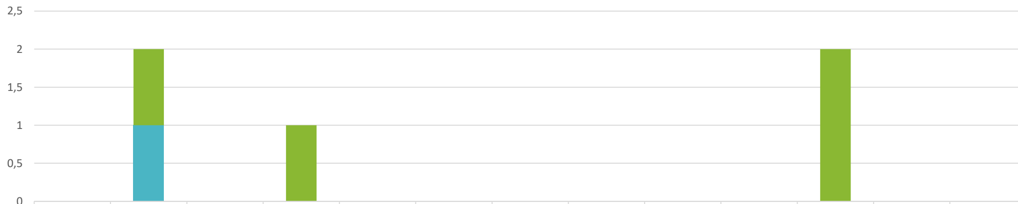
Casi confermati altre arbovirosi

Monitoraggio settimanale altre arbovirosi - Dati estratti dal portale ISS Arbovirosi